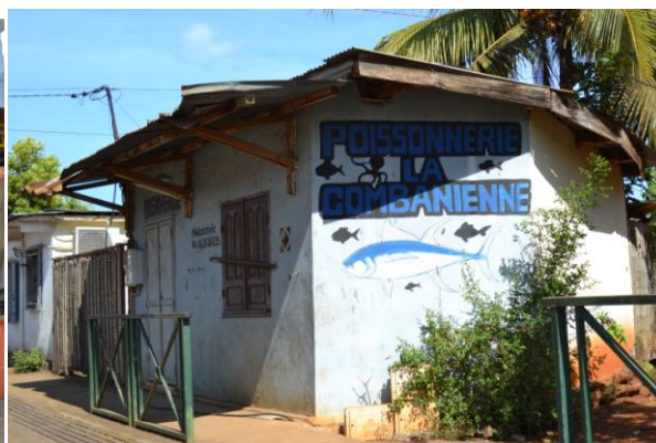
Magasins de proximité