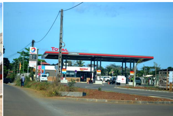
Marché quotidien de Combani et nouvelle station-essence