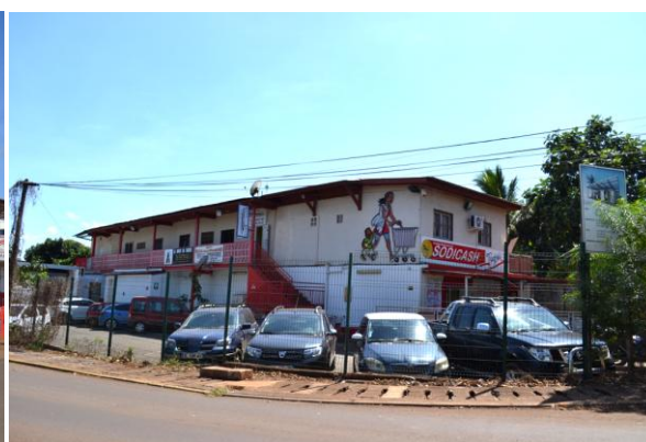
Magasins spécialisés et supermarchés